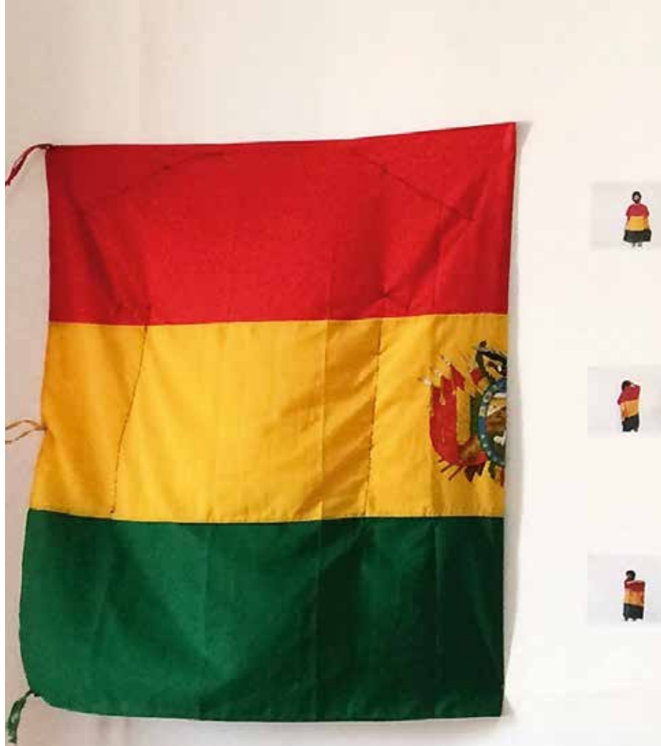
(1) DOUGLAS RODRIGO RADA / Objeto para vestir