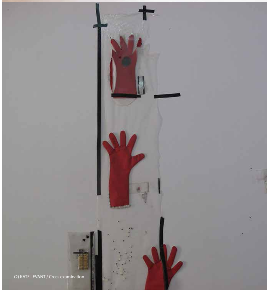
(2) KATE LEVANT / Cross examination