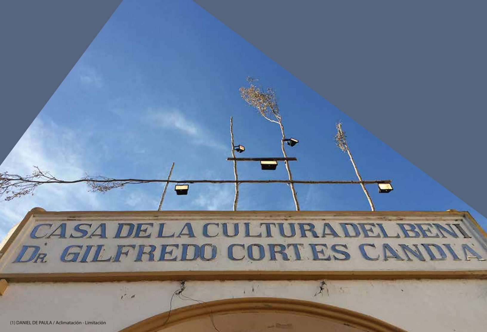
(1) DANIEL DE PAULA / Acimatación - Limitación