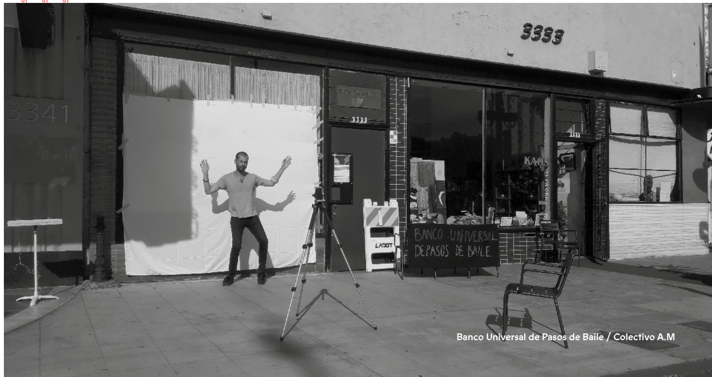
Banco Universal de Pasos de Baile / Colectivo A.M